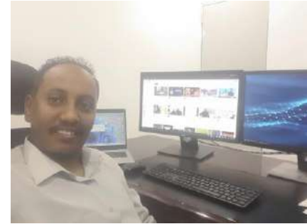
يجب ان تكون الصورة الشخصية لائقة للشهادة الجامعية

اثبات الشخصية يمكن ان يكون جواز سفر بطاقة قومية رقم وطني