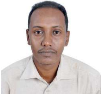
المرفق الصورة مقبول