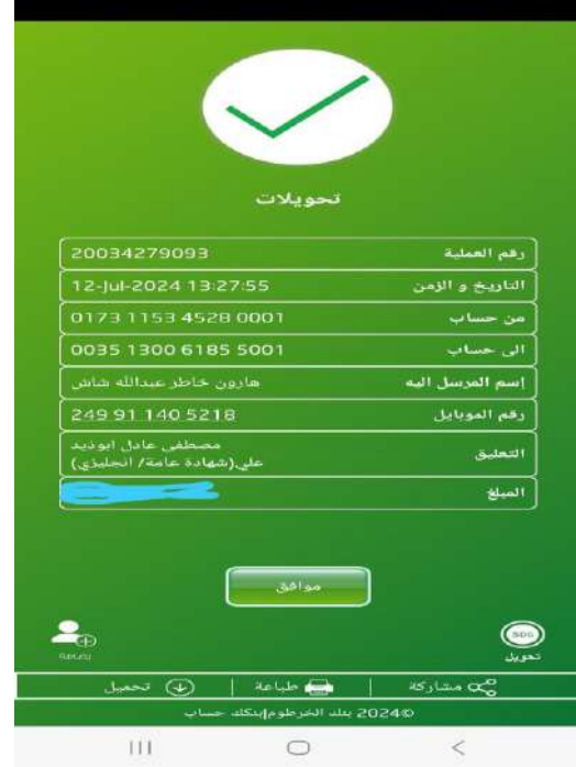
الاشعار الاخير مرفوض