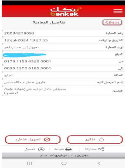
الاشعار الذي يجب ارفاقه